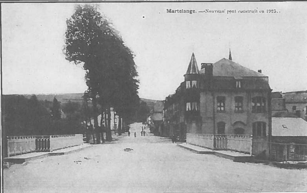
Martelange. —Nouveau pont construit en 1925.