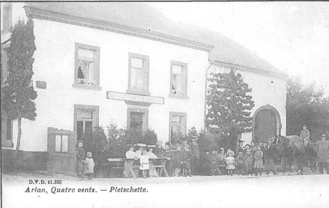
D.V.D. 11.330 Arlon, Quatre vents. — Pletschette.