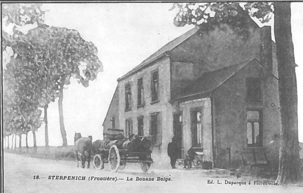
18. — STERPENICH (Frontière). — La Douane Belge.