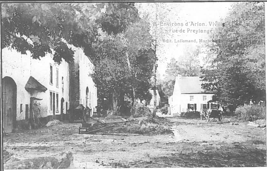
Environs d'Arlon. Viùlle rue de Preylange Edit. Lalloumand, Marbehan