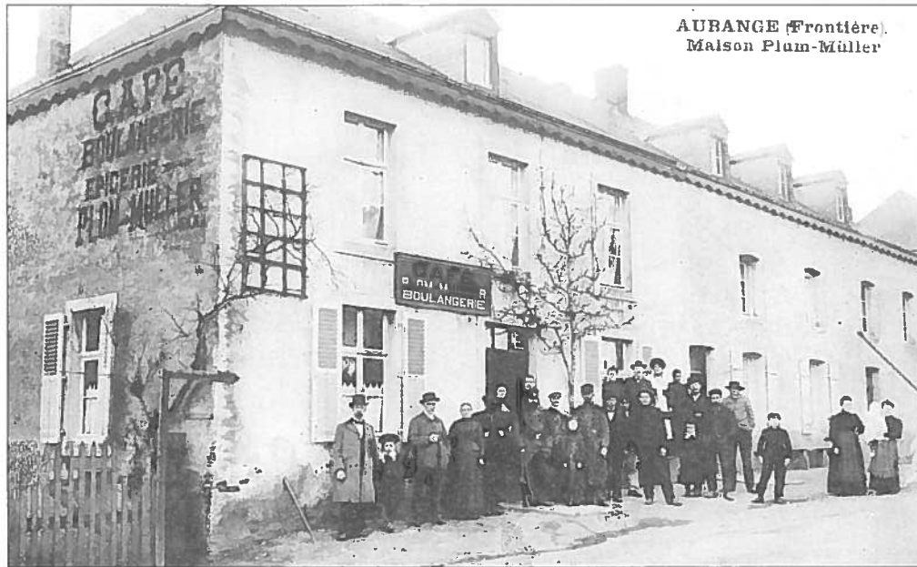
AUBANGE (Frontière) Maison Plum-Müller