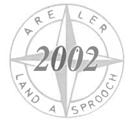
HACHY: Cours d'apiculture au Pensionnat des Frères (oblitéré en 1911)