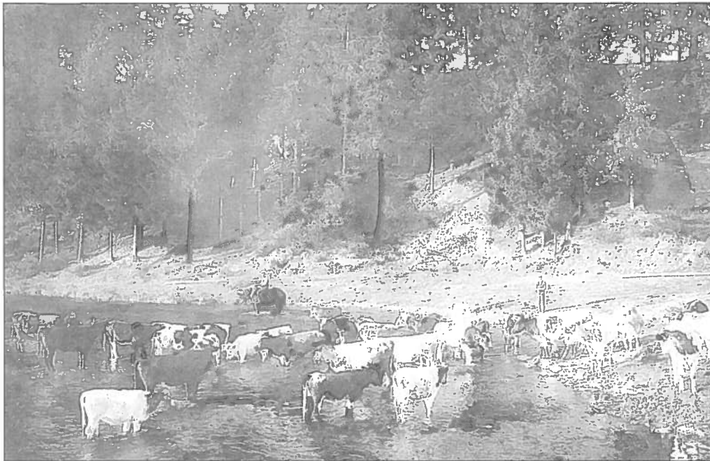
MAARTEL: En Trapp Kéi vun Eilerhaff MARTELANGE: Troupeau de la Ferme d'Oeil