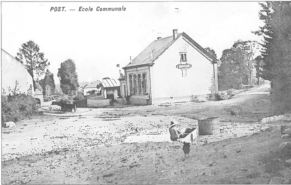
PASS: D'Gemenge Schoul an de Bur (gest. 1912) POST: Ecole communale et abreuvoir (oblitéré en 1912)