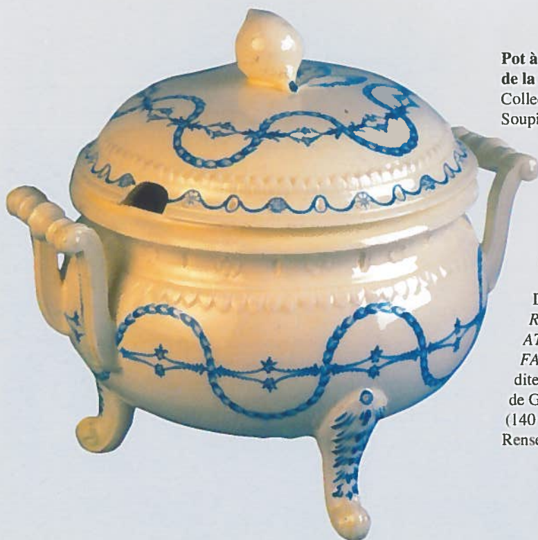
Pot à oille en terre de Pipe de la Faïencerie Poncelet d'Attert (1781-1809).

O meng Modi, wat e Stodi, Voller Zodi, Josefin, Ech gesinn dech nach e wéineg An da ginn ech, Josefin.