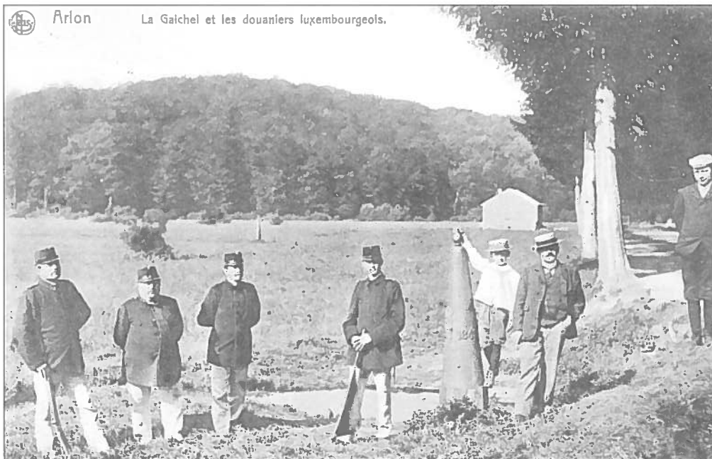
AREL: D'Lëtzebuenger Douanieren an der Gäichel (gest. 1912)