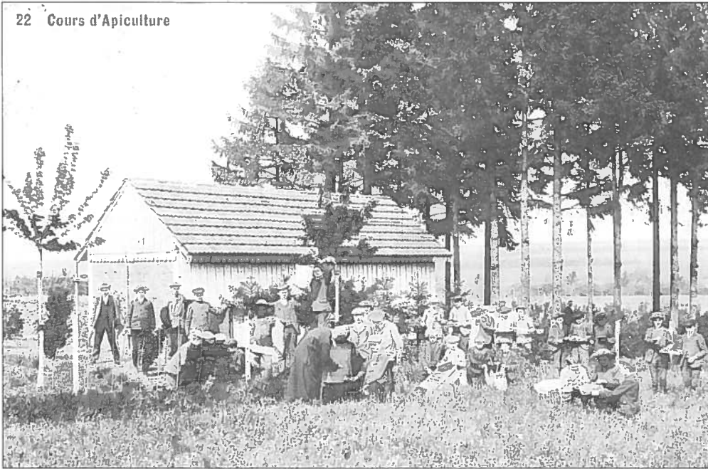
HÄERZEG: Cours vu Beienzuucht am Pensionnat (gestempelt an 1911)