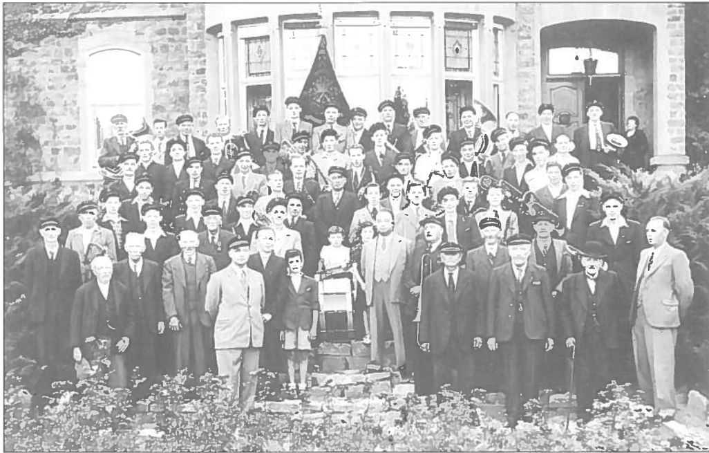
MIEZEG: D'Musek "Royale Concordia" virum Château "Les Clématites" MESSANCY: La "Royale Concordia" devant le Château des Clématites (concours de 1947)