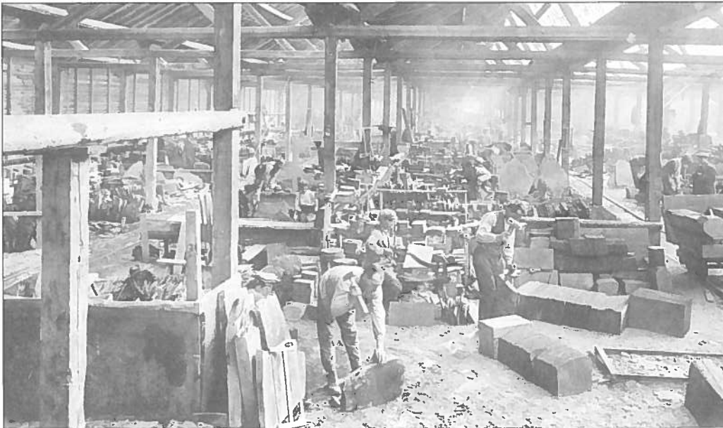
32. Teil der Spalthütte der Schiefergruben, L. DONNER in Martelingen (Belgien)