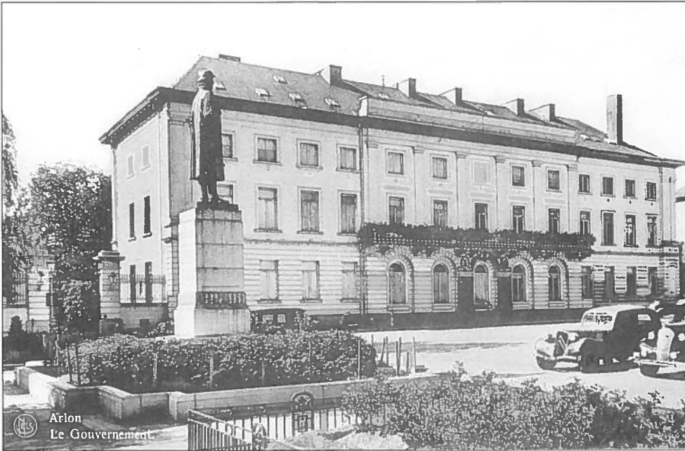
AREL – ARLON : D’Gouvernement an d’Monument vum Kinnek Albert 1er Le Gouvernement et la statue du Roi Albert 1er