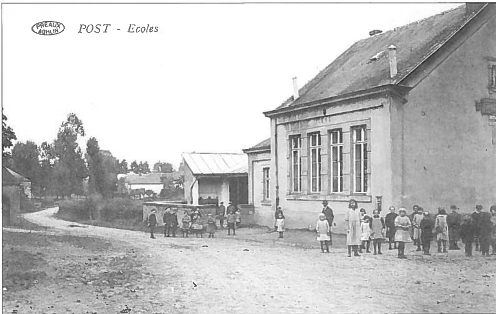
PASS – POST : D'Schoulen an d'Schoulkanner (géint 1930) Ecoles, écoliers et écolières