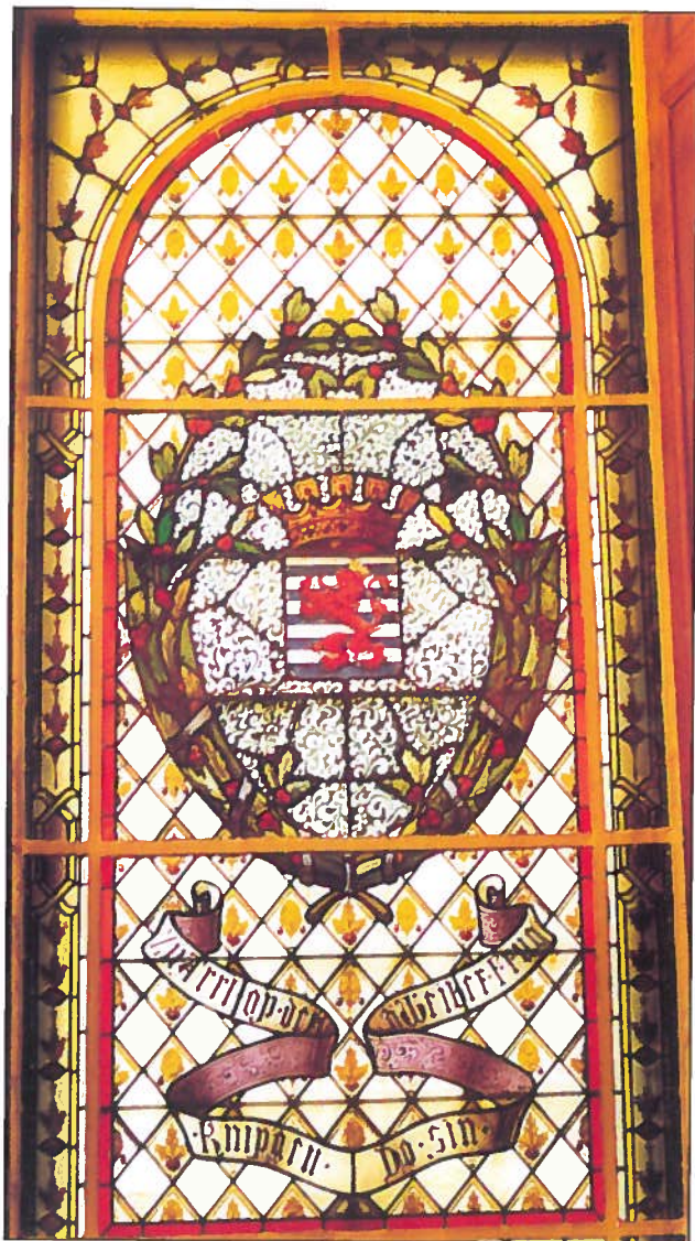
Vitraïl du peintre-verrier bruxellois B. Bardenhewer réalisé en 1909 pour l'hôtel de ville d'Arlon et portant en banderole les 2 premiers vers de cette chanson arlonaise

1. Zu Arel op der Knippchen, Do sin déi Weiber frou ; Si drénke gär eng Schlippchen, eng rifft der aner zou :