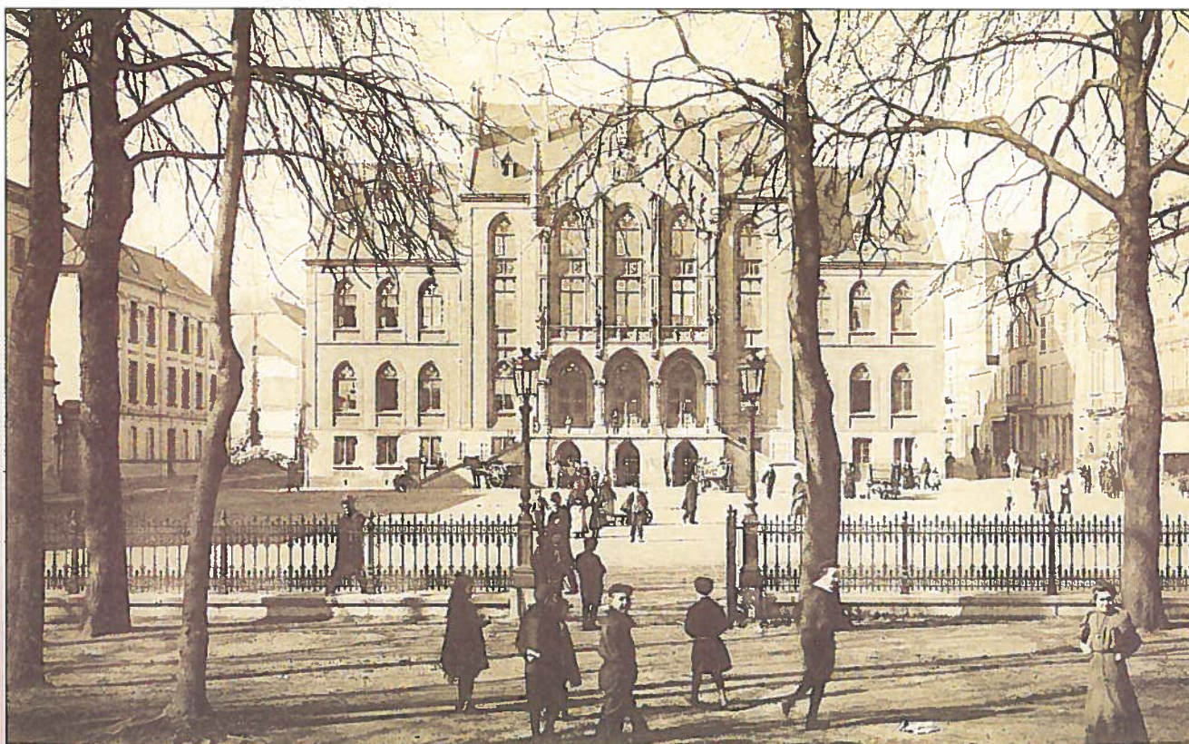
Arion. Le palais de Justice vu du kiosque

Témoin de l'authenticité culturelle de l'Arelerland, ce calendrier allie l'humour à la sagesse populaire, faisant fleurir chaque jour un proverbe, un dicton ou une expression en langue luxembourgeoise.