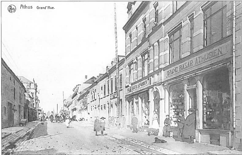
ATTEM – ATHUS : D'Groussgaass an d'Buttéker (géint 1920) La grand'rue et les magasins