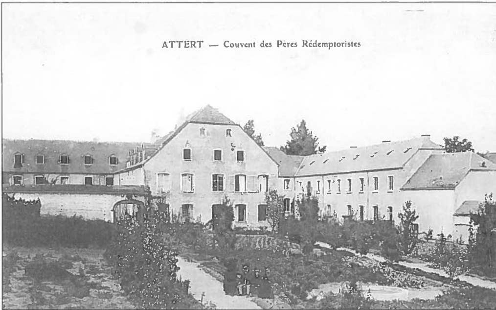
ATTERT – ATTERT : D’Klouschter vun de Pateren (géint 1920) Couvent des Pères Rédemptoristes