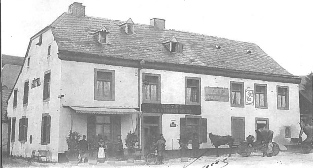
MARTELANGE. — Hotel de la Maison Rouge.