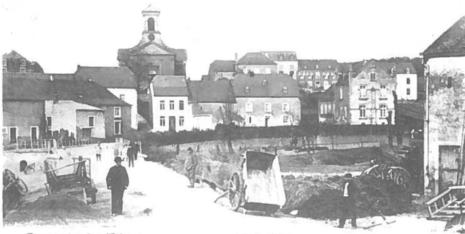
Souvenir de Arelus.