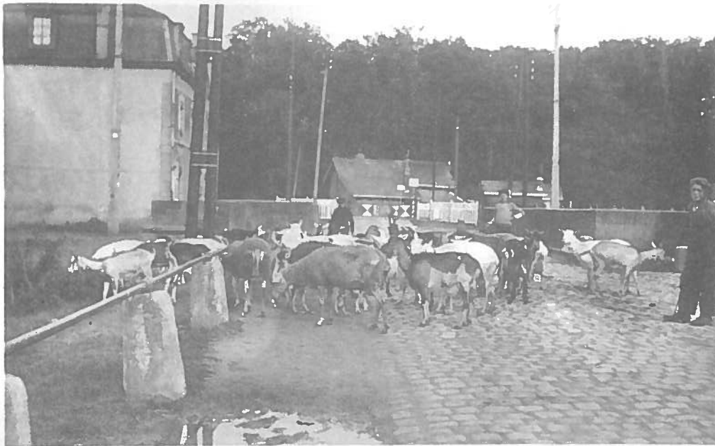
Messancy Scène champêtre