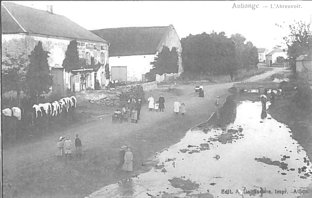
Edlt. A. Dalsigne. Impr. 1865