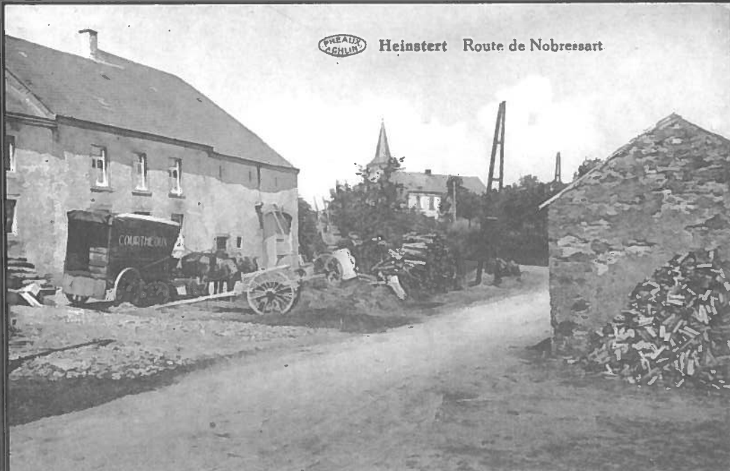
SPRECHER SACHLIN Heinstert Route de Nobressart