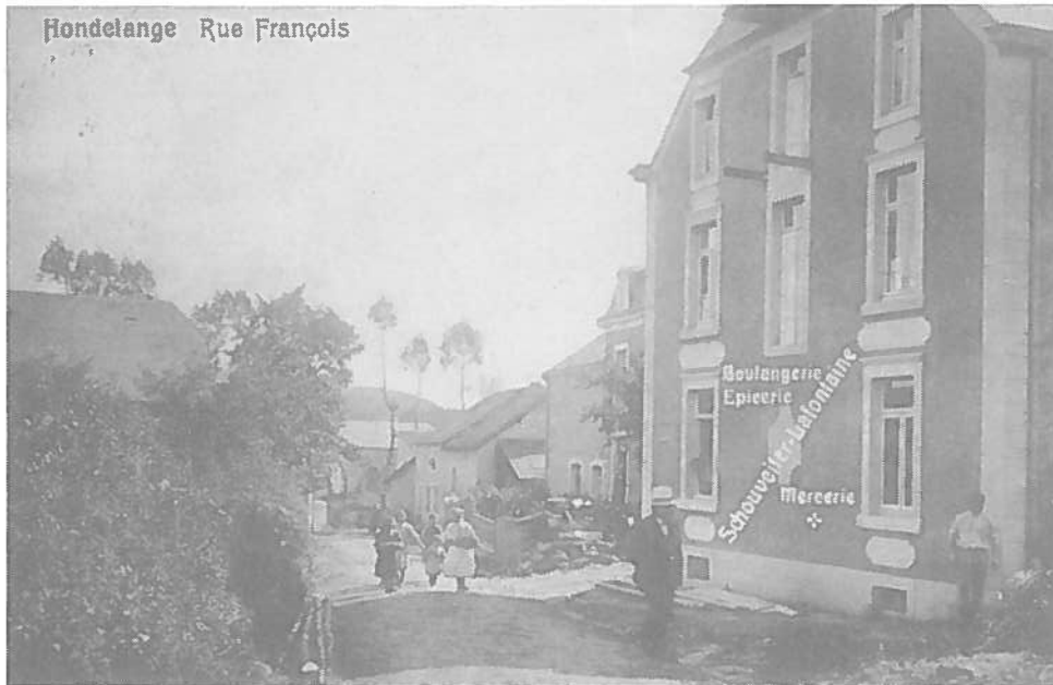
Hondel : D'Bäckerei an der Strooss "François".