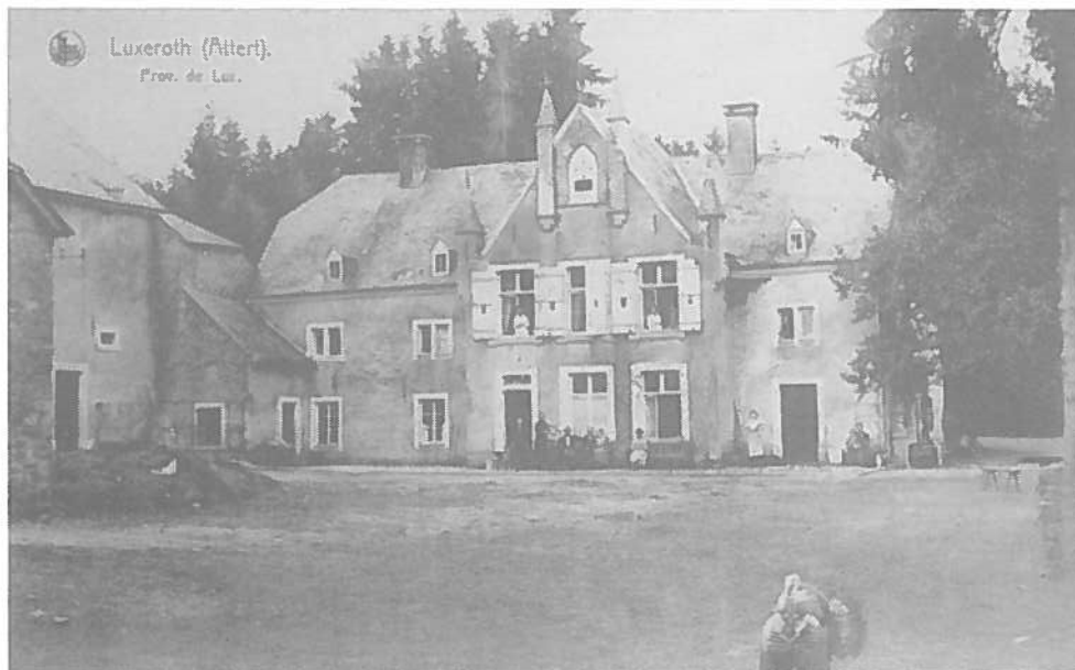
Luxert : Ee Bauerenhaff