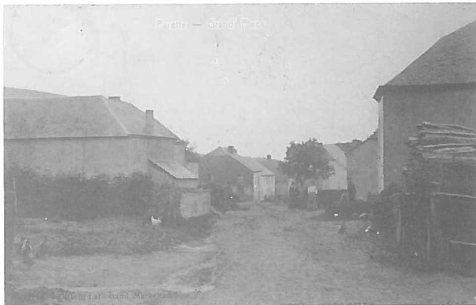
Part : D'Grouss Plaz.