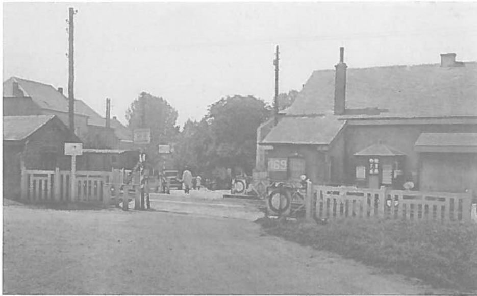
Tiirpen : D'Gare (Halte)