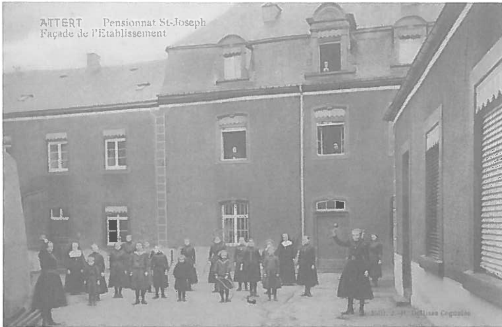
Atttert : D"Schoul "Pensionnat St Joseph".