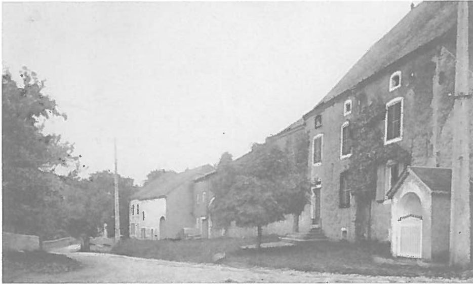
Tontel : Den ale Greinerhaff