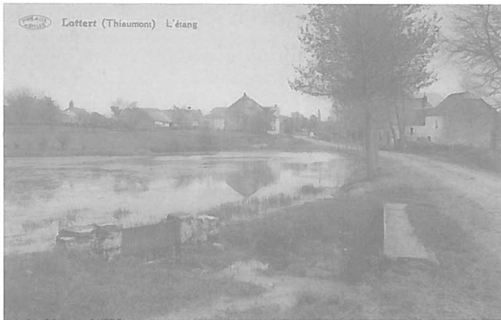
Lottert (Thiaumont) L'éiang