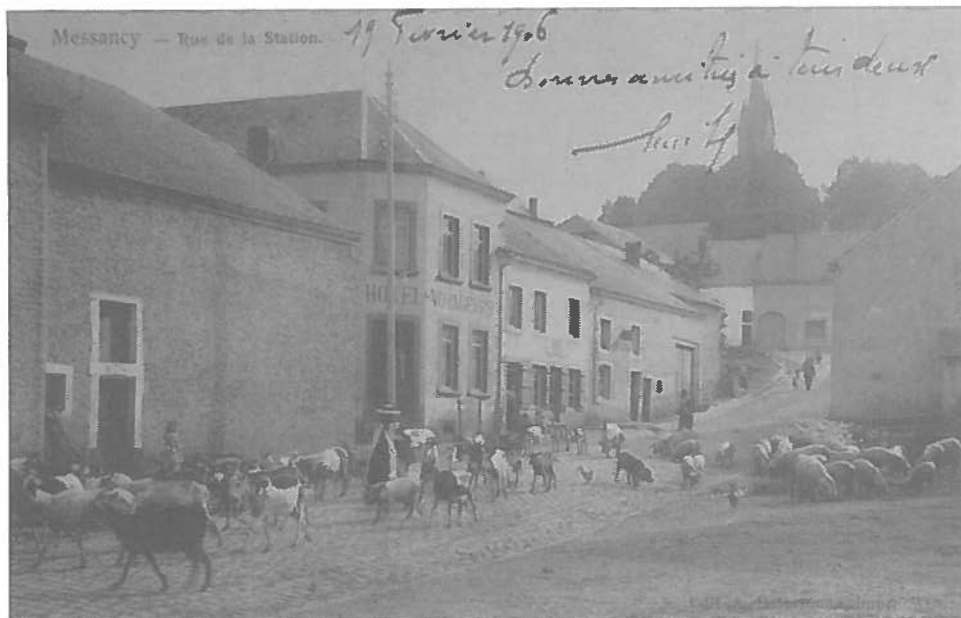
Miezeg : De Statiounerwee an d'Häerd